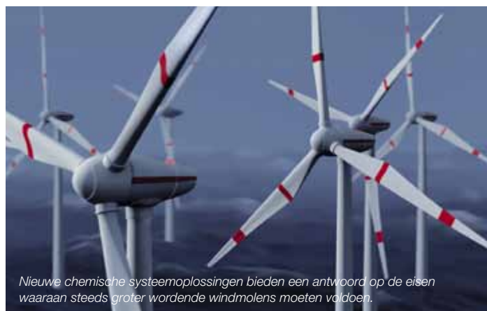
Nieuwe chemische systeemoplossingen bieden een antwoord op de eisen waaraan steeds groter wordende windmolens moeten voldoen.