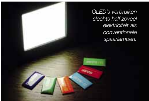
OLED's verbruiken slechts half zoveel elektriciteit als conventionele spaarlampen.