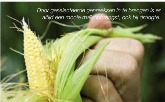
Door geselecteerde genreeksen in te brengen is er altijd een mooie maisopbrengst, ook bij droogte.