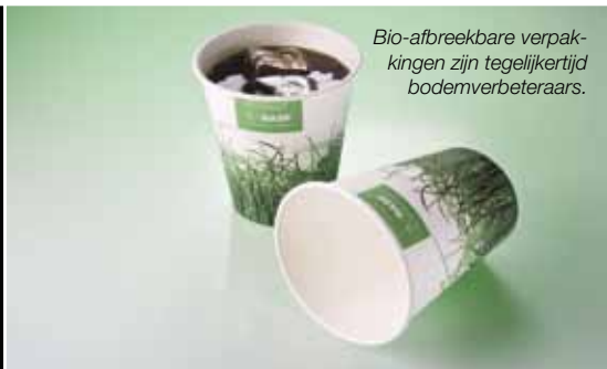
Bio-afbreekbare verpakkingen zijn tegelijkertijd bodemverbeteraars.