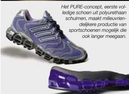
Het PURE-concept, eerste volledige schoen uit polyurethaan schuimen, maakt milieuvriendelijkere productie van sportschoenen mogelijk die ook langer meegaan.