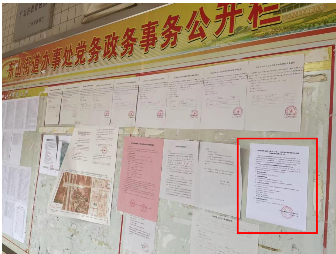
图 3-3a 征求意见稿公告张贴（东山街道办）

本项目征求意见稿公示选取项目附近居民地作为张贴地点，满足建设项目所在地公众易于知悉的场所张贴公告的方式公开，并持续公开 10 个工作日，符合《环境影响评价公众参与办法》（生态环境部令第 4 号）的相关要求。