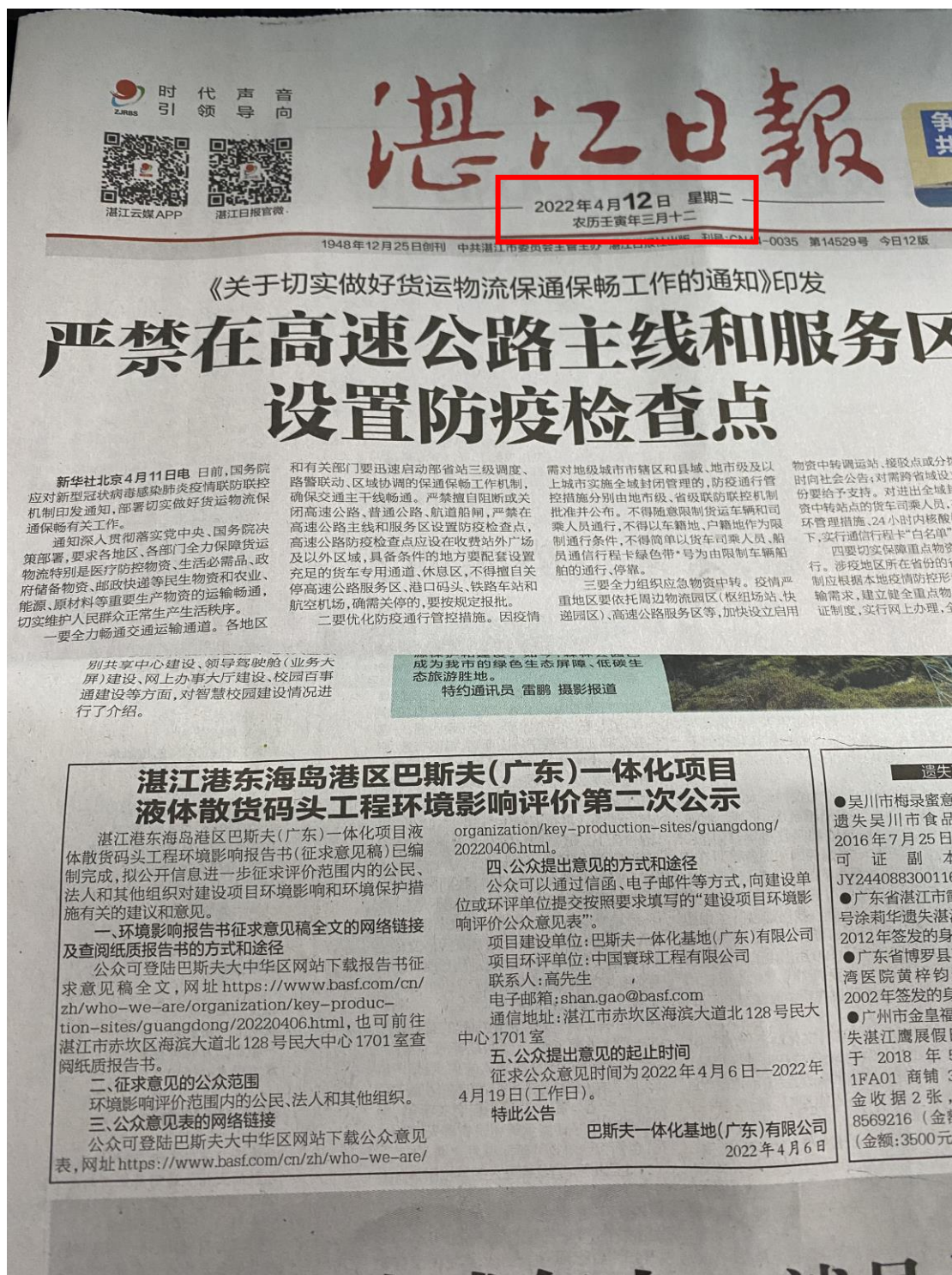
图 3-2b 征求意见稿报纸公示（纸质版，2022.4.12）