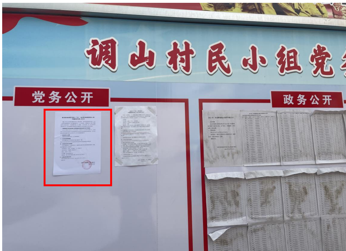
图 3-3b 征求意见稿公告张贴（调山村委会）