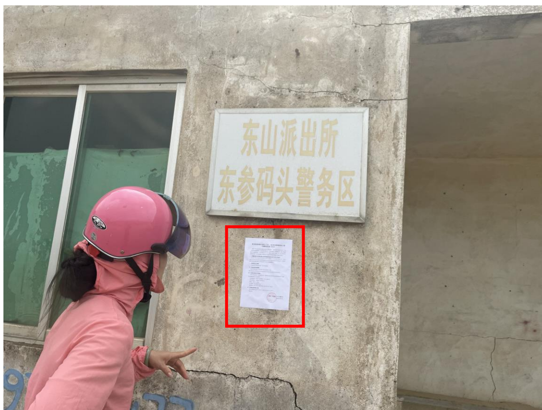
图 3-3c 征求意见稿公告张贴（东参码头）