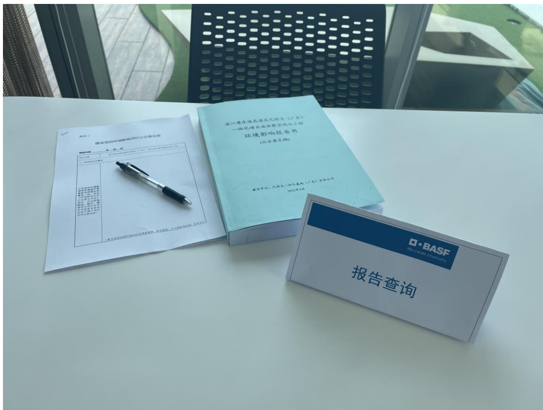
图 3-4 征求意见稿纸质报告书查阅