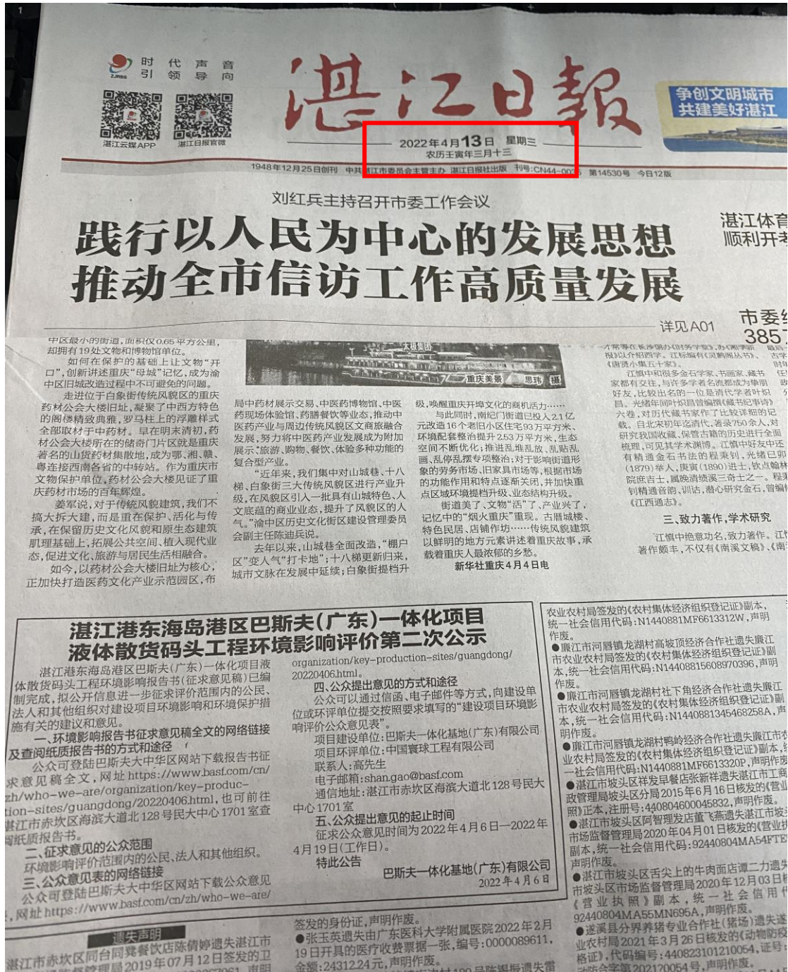
图 3-2c 征求意见稿报纸公示 (纸质版, 2022.4.13)