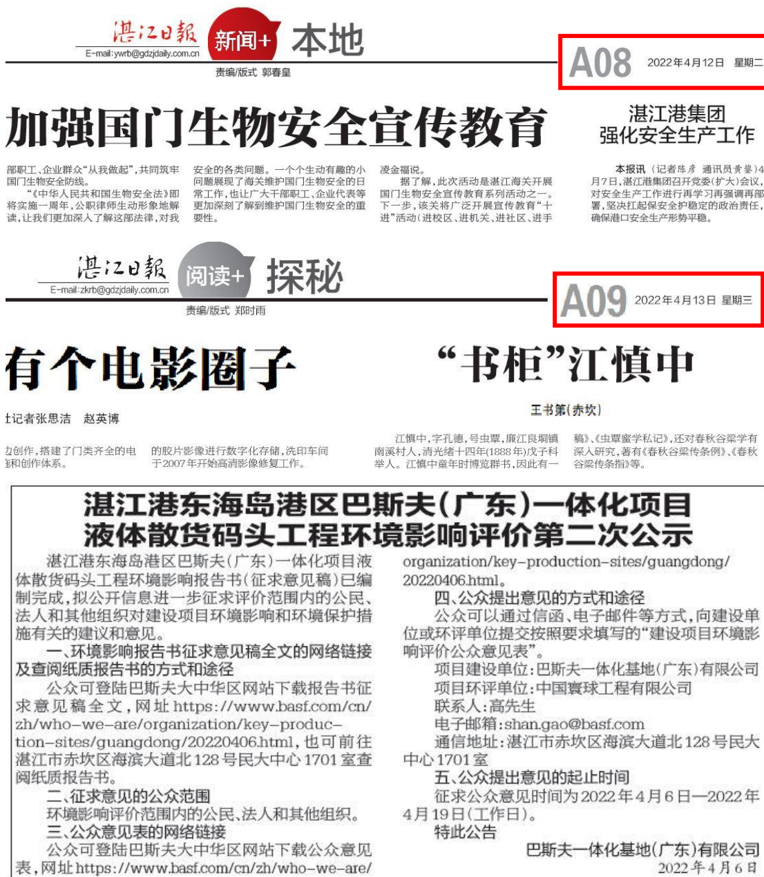
图 3-2a 征求意见稿报纸公示（网络版）

本项目征求意见稿报纸公示方式选取建设项目所在地且公众易于接触的湛江日报（网络版及纸质版）进行报纸公开（图 3-2），且在征求意见的 10 个工作日内刊登征求意见稿公示信息 2 次，符合《环境影响评价公众参与办法》（生态环境部令 第 4 号）的相关要求。