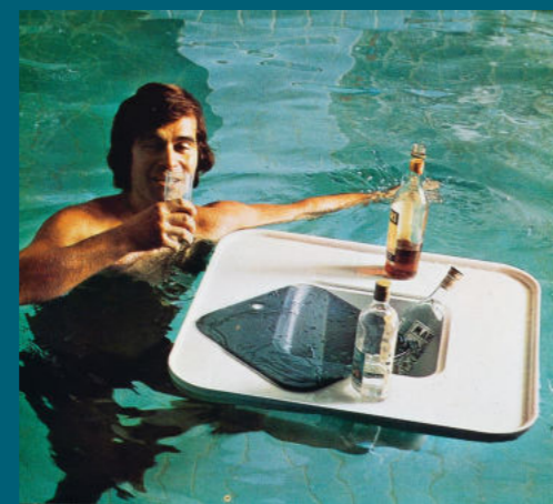
Werbebotschaft zum Tisch Dion von Peter Ghyczy, form+life collection, 1972