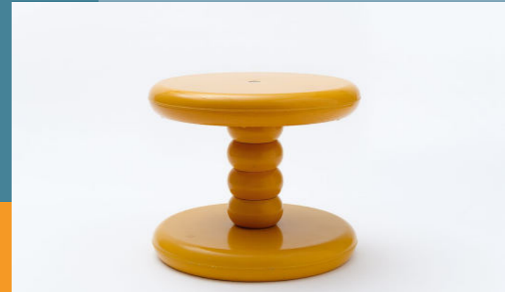
Peter Ghyczy, Tisch Dion, 1969 VEB Synthesewerk Schwarzheide, 1972 © Felix Ghyczy, Kunstgewerbemuseum / SKD, Foto: kienzle/oberhammer