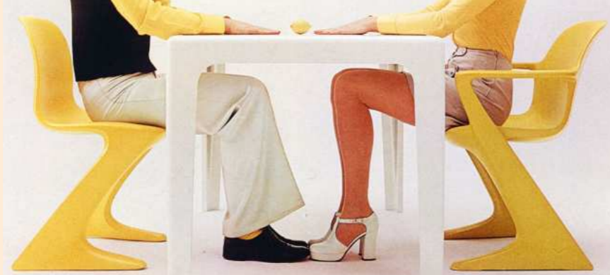
Werbung Horn Collection mit Känguruh-Stuhl, um 1972, Firma Horn

Begeistert von den Möglichkeiten, massenhaft Möbel aus Kunststoff statt aus Holz produzieren zu können, kaufte die DDR Anfang der 1970er Jahre in der Bundesrepublik Maschinen und Designs zur Herstellung von PUR-Möbeln. Bald produzierte sie mehr Kunststoffmöbel aus Polyurethan als jedes andere Land auf der Welt. Diese wurden als Zeichen des sozialistischen Fortschritts inszeniert, ohne die westdeutschen Ursprünge zu benennen. Daneben entstanden an Hochschulen und in Betrieben kreative Eigenentwürfe von ostdeutschen Formgestaltern für Möbel aus PUR, die teils aber keine Umsetzung fanden.