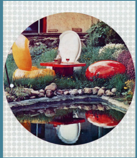
Werbebotschaft SYSpur mit Garten-Ei und Tisch Dion, um 1973