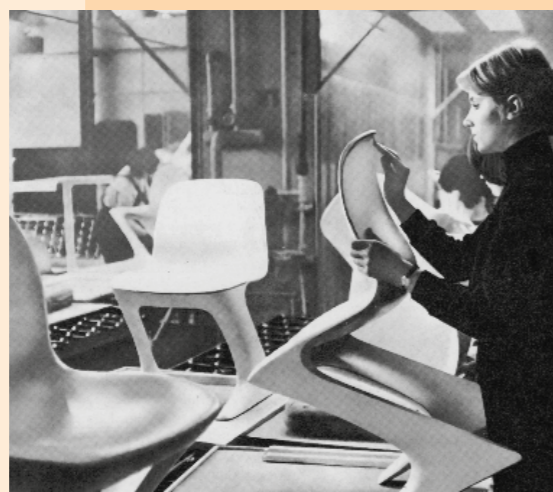
Mitarbeiterin im PCK Schwedt/Oder bei Nacharbeiten am Känguruh-Stuhl, um 1973

Die Ausstellung betrachtet die PUR-Möbelherstellung bis in die frühen 1980er Jahre und zeigt neben Fotos, Werbung und Filmauszügen zahlreiche ikonische und bislang wenig bekannte Möbelbeispiele – entworfen in der Bundesrepublik und der DDR. Sie blickt auf designhistorische und wirtschaftspolitische Aspekte und fragt nach dem künftigen Umgang mit dem schwer recycelbaren Material Polyurethan.