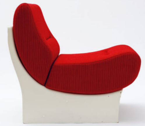
Hans-Jürgen Falley, Polstermöbel- programm Carat 8, 1972, PCK Schwedt