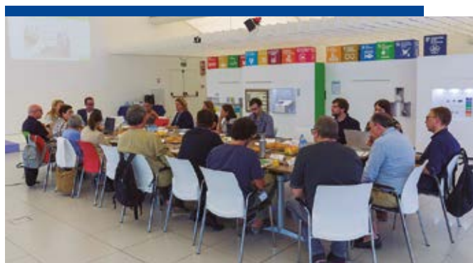
Imagen - Visita del PPA al centro de producción de La Canonja

El panel, pionero en el polígono químico de Tarragona y en BASF en Europa, está formado por personas relevantes en distintos sectores de las localidades de La Canonja y Tarragona. Las reuniones son trimestrales y se tratan temas de interés común para la población, BASF y la industria química, en general.