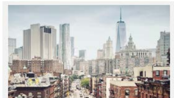
Green Sense® – Betontechnologie für nachhaltiges Bauen

Bitte kontaktieren Sie uns – wir freuen uns auf Ihre Anfrage!