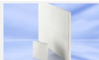
SLENTITE® – Hochleistungsdämmplatte auf Polyurethanbasis