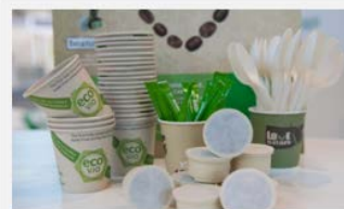
ecovio® – biobasierter und kompostierbarer Kunststoff