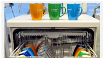
Trilon® M – Alternative zu Phosphat für Geschirrspülmittel