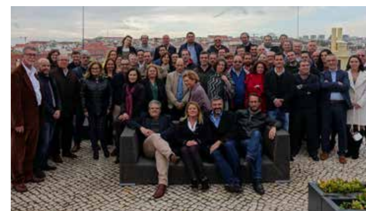
Todos os colegas da BASF Portuguesa, BASF Coatings Services e Chemetall juntos

Para consegui-lo, fomentamos um ambiente de trabalho que inspira e favorece a ligação entre as pessoas. Construimo-lo a partir de um sistema de liderança integrado baseado na confiança mútua, no respeito e na dedicação para alcançar o máximo rendimento.