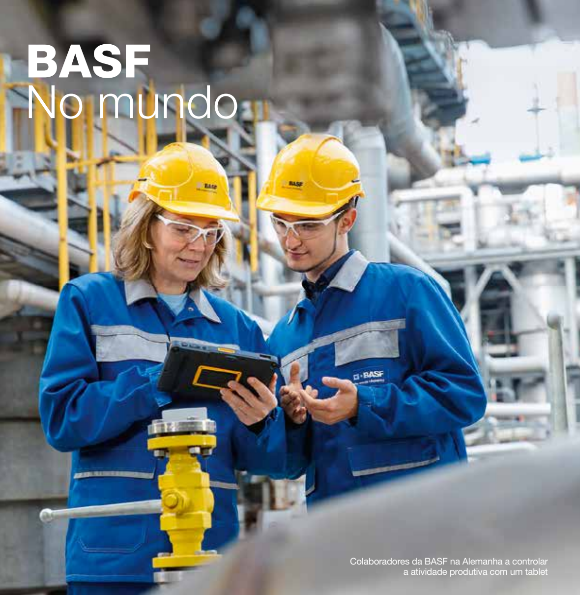
Colaboradores da BASF na Alemanha a controlar a atividade produtiva com um tablet