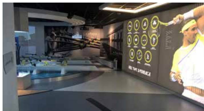
Pavimento de poliuretano insonorizado MasterTop® da BASF no museu do desporto «Sport Xperience by Rafa Nadal»

Nas imagens mostramos exemplos de como os produtos e soluções da BASF contribuem para a conservação dos recursos, para garantir a nossa alimentação e melhorar a nossa qualidade de vida.