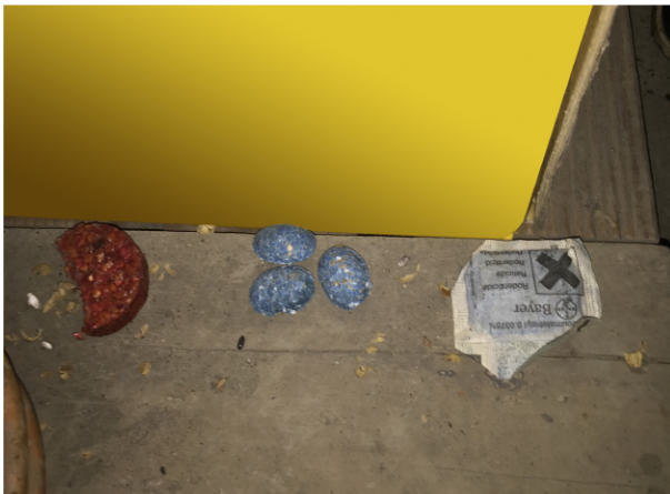
6/3 投置(重新放置一錠鼠)